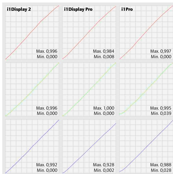
Unterschiede beim gleichen Monitor: Mit drei Messgeräten erzeugte Profile schreiben verschiedene Korrekturen auf die Grafikkarte, dies trotz identischer Einstellung der Hardware. Beim i1Display Pro fällt der wärmere Weisspunkt auf – auch visuell in der Bildschirmdarstellung.

teils so auseinandergerissen werden, dass ursprünglich vorhandene Tonwerte zum Teil übersprungen werden. Im einen Fall geht dadurch in der Darstellung Detailzeichnung verloren, im anderen können die Tonwertsprünge als so genannte Abrisse in Verläufen sichtbar werden. Es gibt allerdings ein technisches «Hintertürchen», um derartigen Tonwertverlusten vorzubeugen. Dann, wenn der Monitor eine interne Farbtabelle (LUT = look-up table) mit höherer Bittiefe besitzt. Eine LUT mit zehn Bit je Kanal hat 1024 Tonwertstufen, aus denen bei der Kalibration jene 256 herausgepickt werden, die am nächsten bei den Sollwerten für die gewünschte Tonwertkurve liegen. So lassen sich Detailverluste und Abrisse vermeiden; auch in der korrigierten Darstellung behält jeder Kanal 256 voneinander verschiedene Tonwerte. Der Haken daran ist, dass sich die 1024 möglichen Tonwerte über ein 8-Bit-Grafiksignal nicht direkt ansprechen lassen. Es braucht also eine spezielle Steuerung, die es der Kalibrationssoftware ermöglicht, direkt und in der vollen verfügbaren Bittiefe mit der Monitorhardware zu kommunizieren, um die optimale Zuordnung der Tonwerte zwischen der genaueren LUT des Monitors und dem meist auf 8 Bit beschränkten, vom Rechner gelieferten Grafiksinal vorzunehmen. Genau dies ist der schlagende Vorteil von hard-