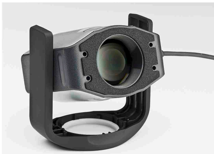
Der Diffusorteil dient auch als Standfuss für die Ausrichtung auf eine Projektionsfläche.