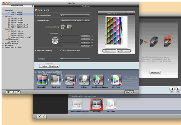
Die Benutzerführung im Basismodus mit rotem Reiter und Pfeiltasten für die Arbeitsschritte (unteres Fenster) ist klarer als beim erweiterten Modus (oberes Fenster).

Eric A. Soder gestaltet und produziert Drucksachen, berät Anwender in Sachen IT/digitale Bildverarbeitung/Farbmanagement, zudem fotografiert er für Bildagenturen und schreibt Fachartikel über Fotografie, Digital Imaging und Druckvorstufe. www.pixsource.com